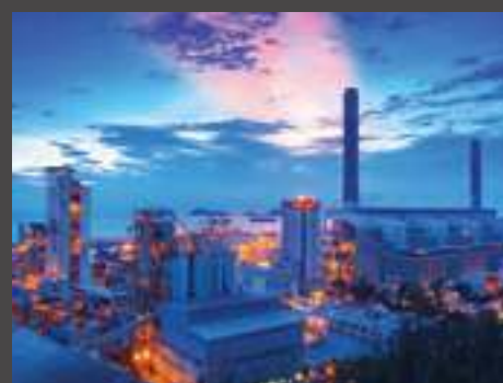
petrolifero oil & gas