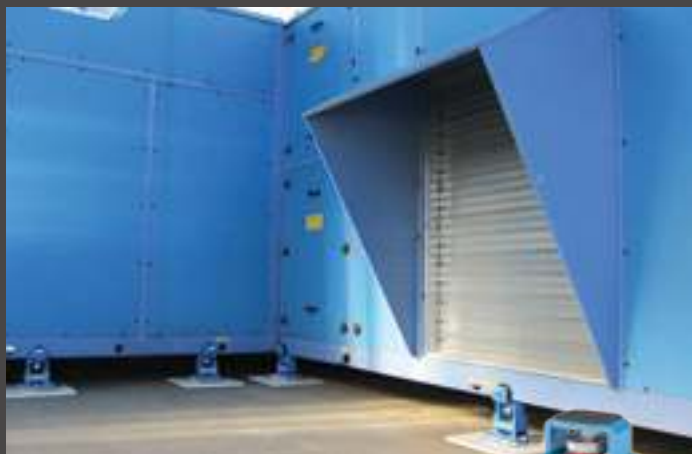
antivibranti antisismici seismic mounts