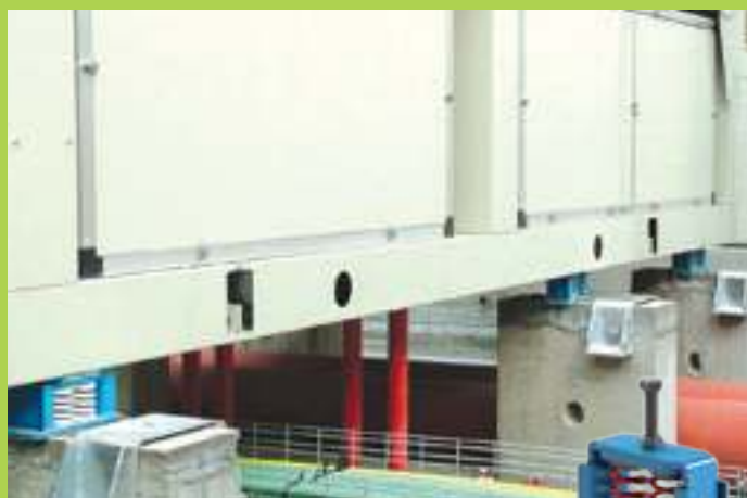
antivibranti con limitatori di spinta housed spring anti-vibration mounts