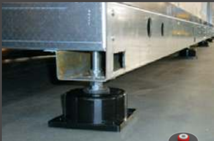
smorzatori in elastomero elastomeric dampers