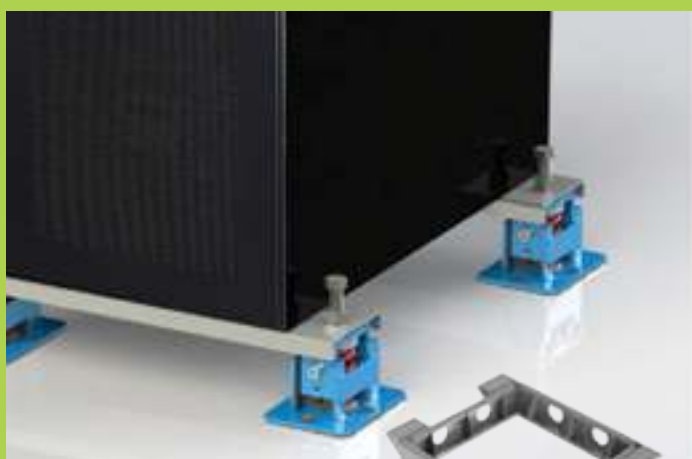
basamenti antisismici structural bases