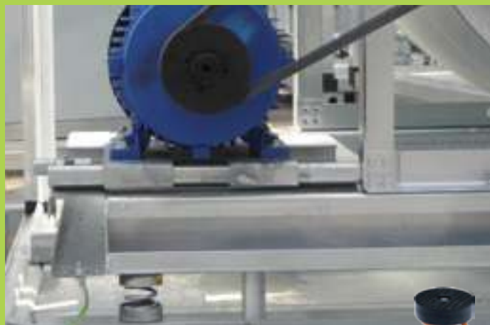
antivibranti monomolla single spring mounts