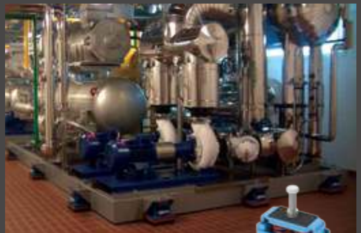
antivibranti antisismici seismic mounts