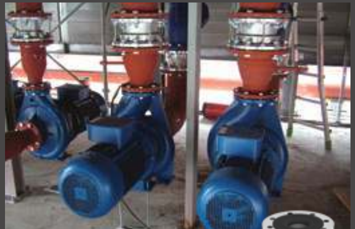
giunti antivibranti UNOFLEX anti-vibration pipe joints UNOFLEX