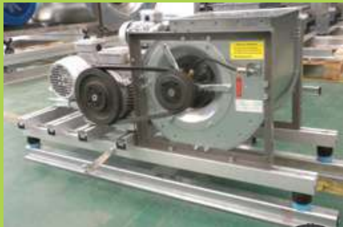
antivibranti in elastomero con molla elastomeric spring anti-vibration mounts