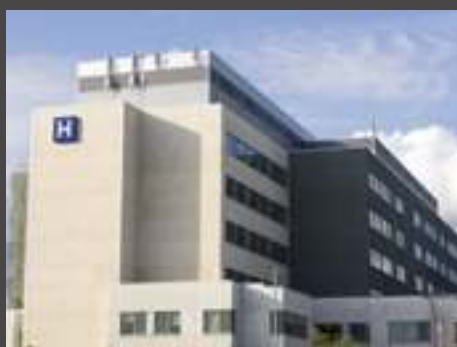
residenziale e commerciale residential & commercial