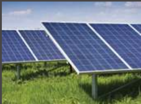
energie rinnovabili renewable energy