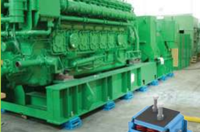
antivibranti antisismici seismic mounts