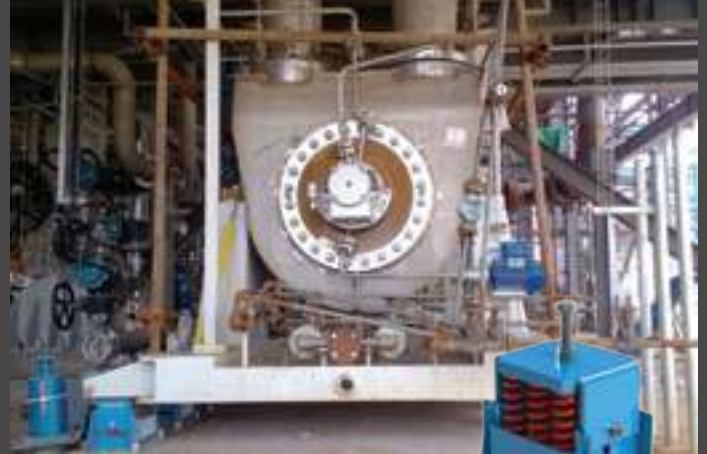
antivibranti antisismici seismic mounts