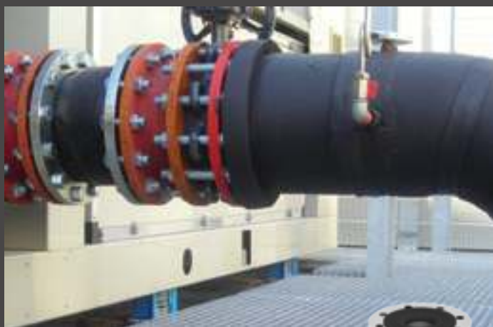
giunti antivibranti UNOFLEX anti-vibration pipe joints UNOFLEX