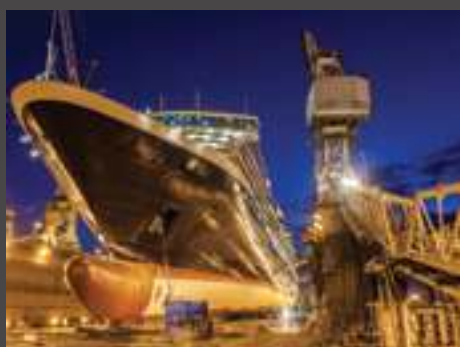
navale marine industry