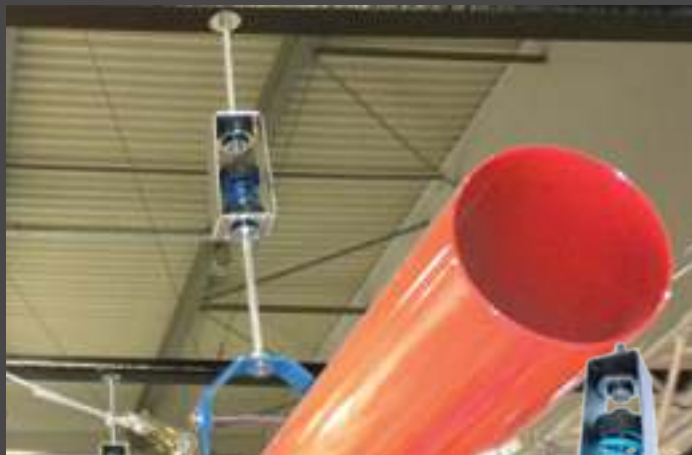
sospensioni a molla spring hangers