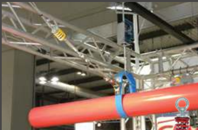
sospensioni a molla spring hangers