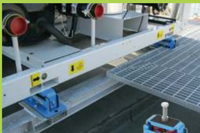
antivibranti antisismici seismic mounts