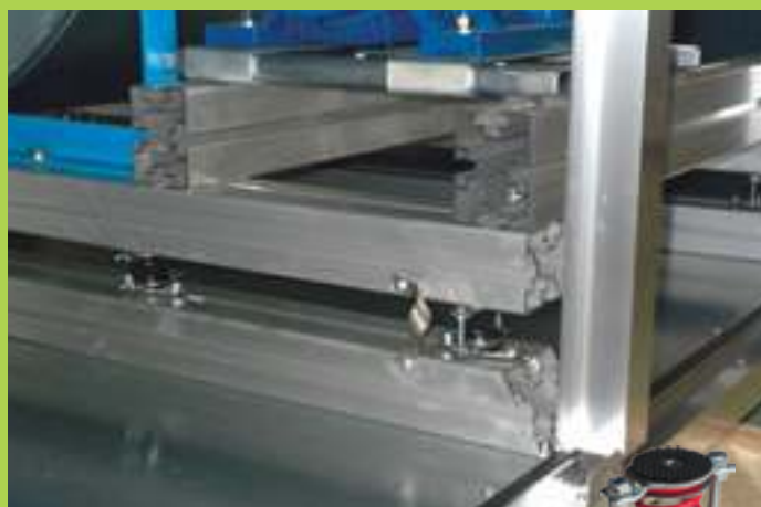
antivibranti monomolla single spring mounts