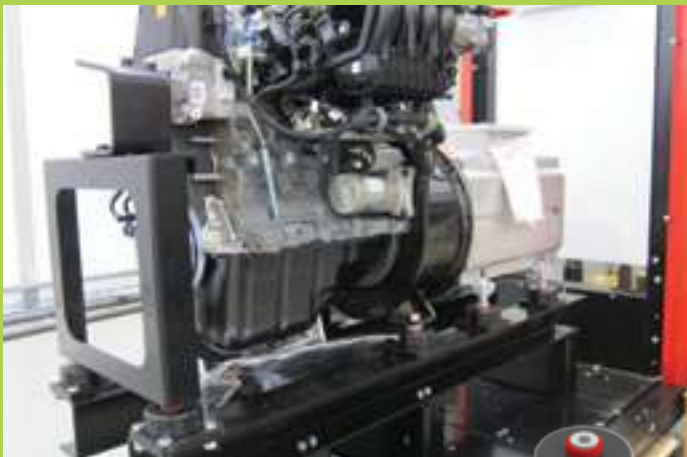
smorzatori in elastomero elastomeric dampers