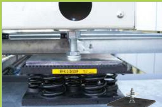
antivibranti plurimolla multiple spring mounts