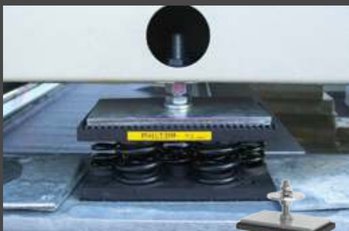
antivibranti plurimolla multiple spring mounts