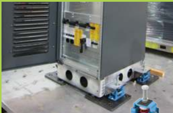
antivibranti antisismici seismic mounts