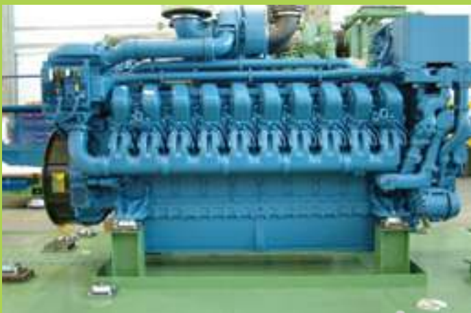
smorzatori campana gomma metallo rubber-metal dampers