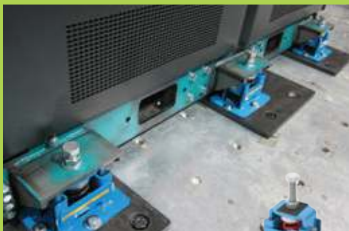
antivibranti antisismici seismic mounts